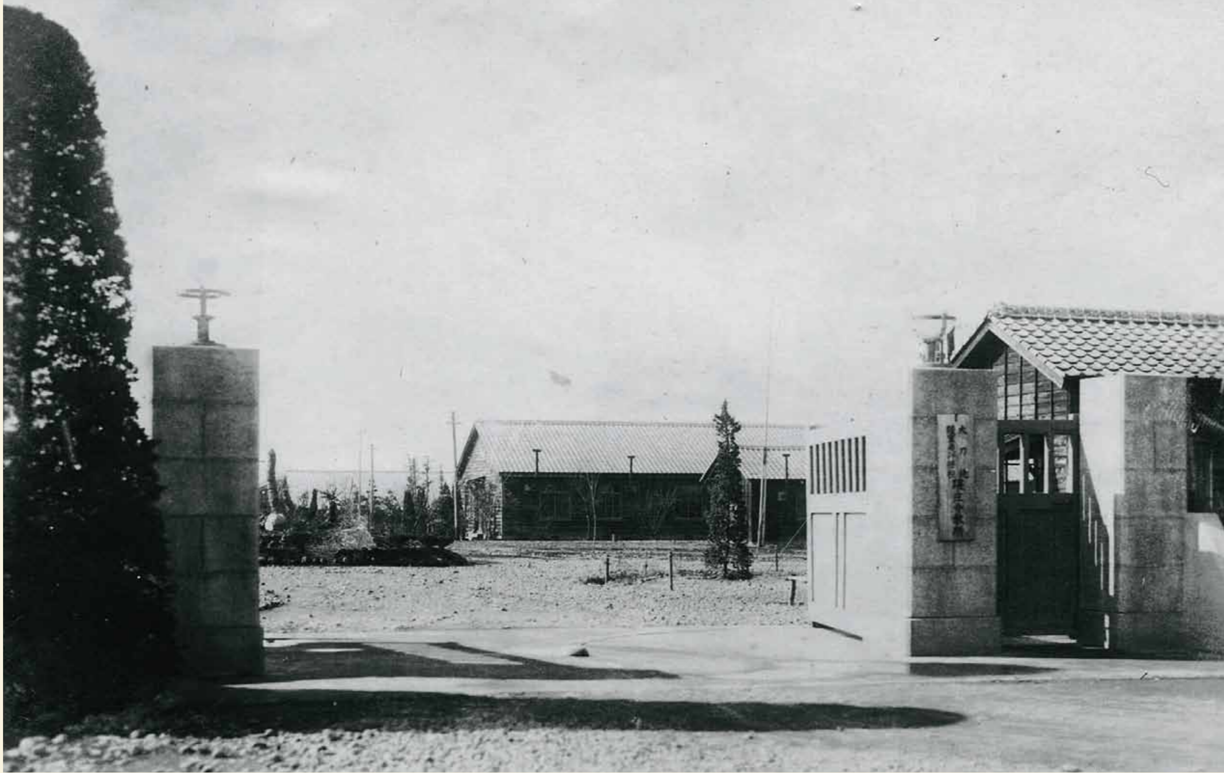
陸軍大刀洗飛行学校隈庄分教所時代の看板と正門、本部棟建物