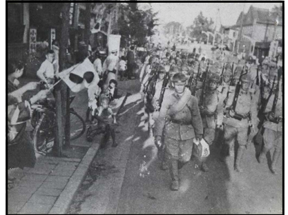
出征する陸軍歩兵十三聯隊兵士