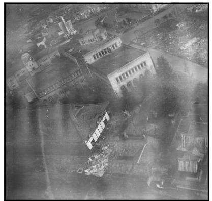
8月10日熊本市公会堂への攻撃