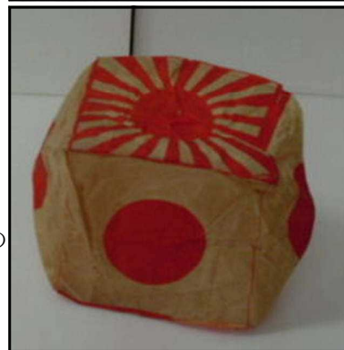
上：大浜飛行場練習機「ユングマン」 下：戦時紙風船「日の丸」