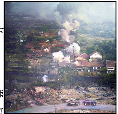
1945年8月10日米軍機市街地空襲。AIと証言でカラー化