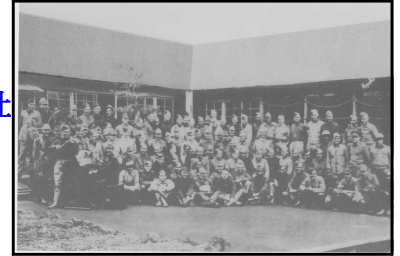
田浦捕虜収容所での1944年12月、日本軍によるプロパガンダ「クリスマスイベント」