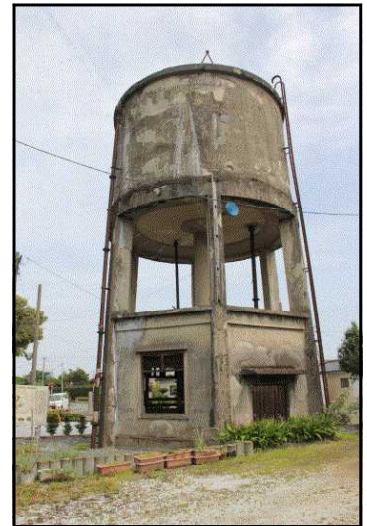
菊池市指定文化財「花房飛行場給水塔」菊池飛行場

「花房飛行場給水塔」（陸軍菊池飛行場高架水槽・菊池市指定有形文化財）、「永山の掩体壕」（陸軍人吉秘匿飛行場木製有蓋掩体壕・球磨郡あさぎり町登録文化財建造物）の2件。また、合志市の「黒石原飛行場奉安殿」は、保存修復事業を進めており、完了後に国登録文化財となる予定である。また、東京第二陸軍造兵廠荒尾製造所変電所は、荒尾市が所蔵・管理している。