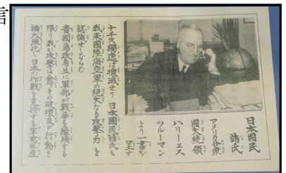
本渡投下のポツダム宣言伝単