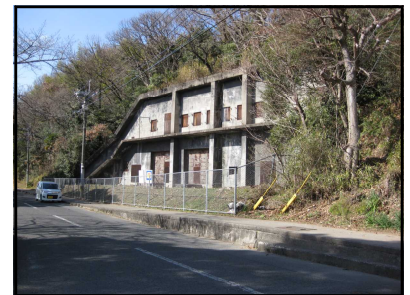
荒尾二造の戦争遺構・変電所跡