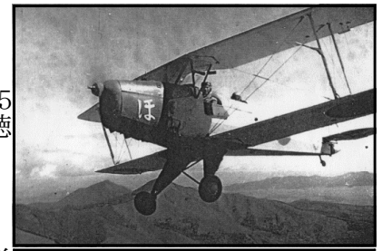
大浜飛行場のユングマン練習機