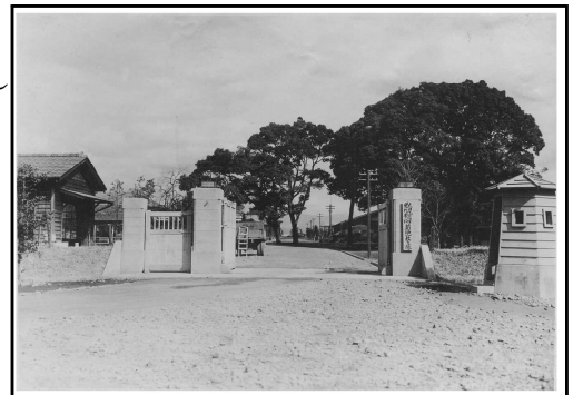
大刀洗陸軍飛行学校菊池教育隊 正門