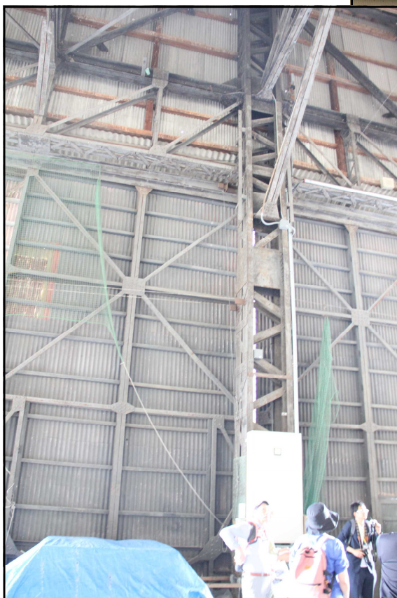
□旧第一組立工場の建物北側内部 扉部の内側構造と天井部の柱材 建物中央部の柱材と天井部トラス構造