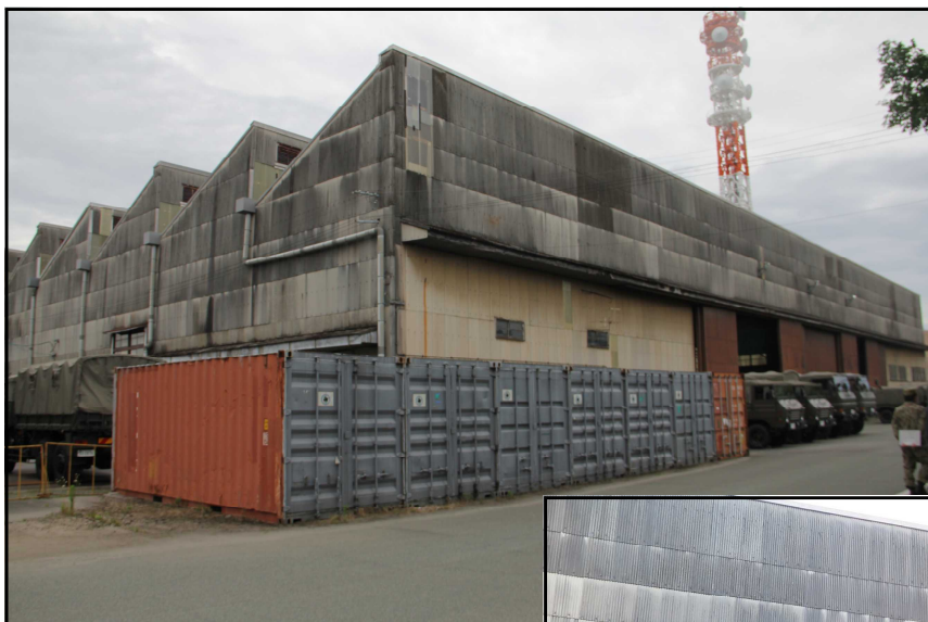
□旧第一組立工場の外観 北側屋外全容と三角屋根状況