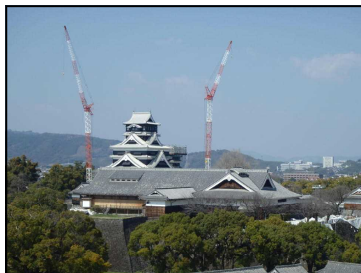
熊本城復旧の様子 平成31年3月9日撮影

久しぶりの参加でしたが、長時間の協議ありがとうございました。良い全国大会なるよう全員で協力していきしょう。