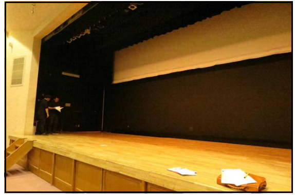
□ 6階ホール舞台、白幕