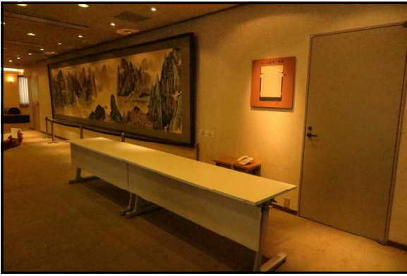
□ 6階ホール前のロビー受付