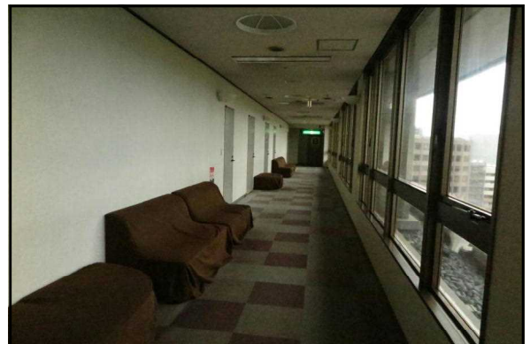
□ 座席表：最大230人 □ 6階ロビー展示用パーティション □ 6階ロビー □ 7階展望所