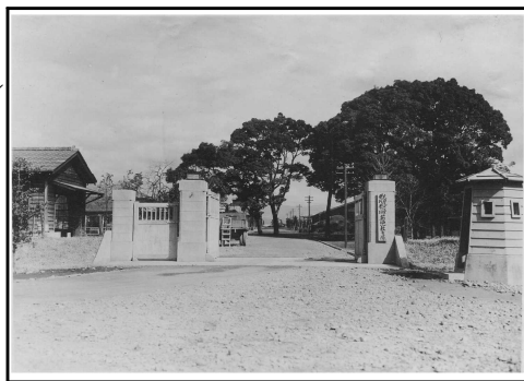
大刀洗陸軍飛行学校菊池教育隊 正門