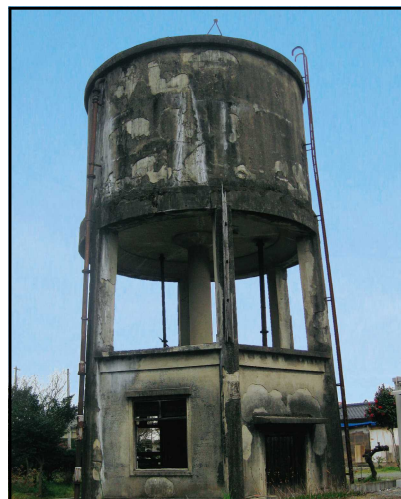
菊池飛行場 花房給水塔