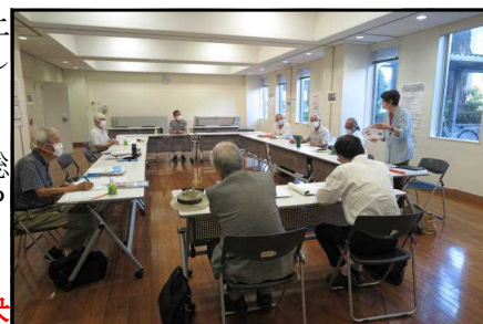
事務局会の様子。休息中は換気を徹底