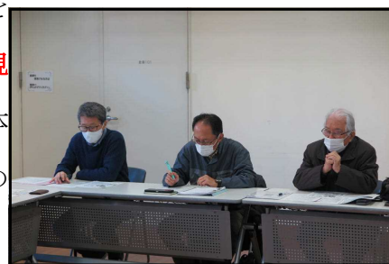
事務局会での協議の様子