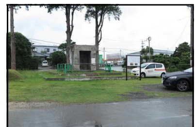
落書き除去、説明看板も建ち、整備が進む「黒石原飛行場奉安殿」