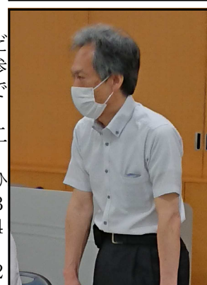
県福祉課高島課補佐長の挨拶