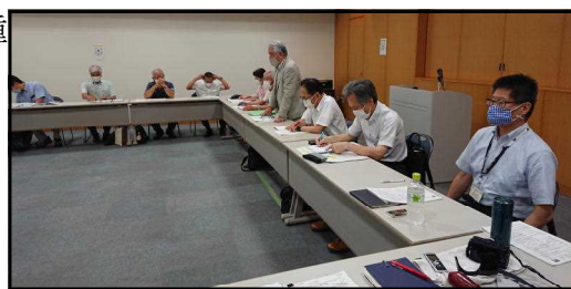
三密を回避した全体協議の様子